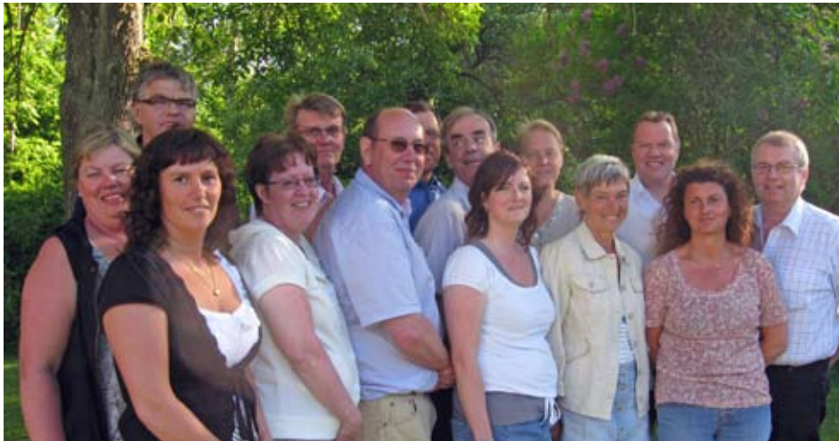
Hela styrelsen samlad på ett somrigt Gotland i samband med styrelsemöte.

Hela Sverige ska levas vill gå vidare i arbetet och har sökt pengar från Energimyndigheten för det. Tanken är att utarbeta metoder och avtal för att underlätta utbyggnad av vindkraft, samtidigt som det gynnar den lokala nivån.