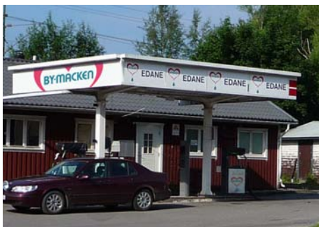
Bymacken i Edane.

I Skaraborg sätter den första macken snart upp skylten ”Bymacken” och i västra Dalarna räknas den första Bymacken kunna öppna vid årsskiftet.