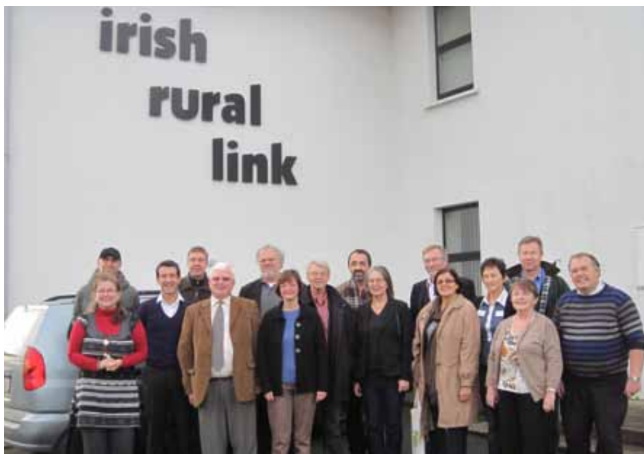
Irish rural link är hela Sverige ska levas motsvarighet på Irland.