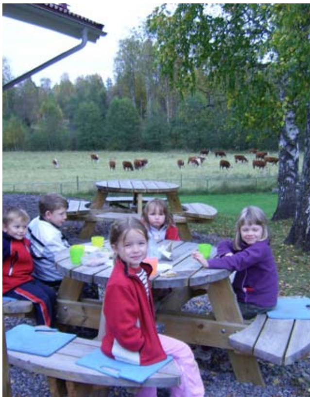
Dags för mellanmål på förskoledagiset Kohagen.

Under våren 2003 stod det klart att Eda kommun i Värmland hade för avsikt att lägga ned bygdeskolorna i Skällarbyn och Lässerud. Bland bygdens befolkning växte opinionen mot detta beslut och en målmedveten kamp tog fart.