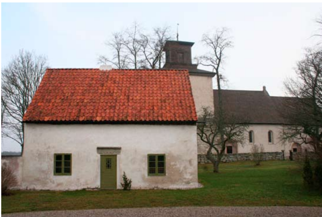
Delar av Vamlingbo prästgård med kyrkan i bakgrunden.