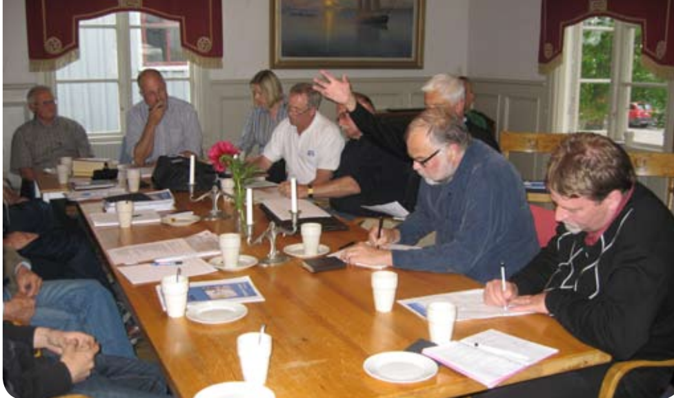
Här pågår lokal planering i Öregrund, Östhammars kommun.

“Öregrund sjuder av engagemang och framtidsanda. För nu finns det en plan. En plan som kommer att befästa Öregrundns ställning som ett centrum för båtturism i Upplands norra skärgård.” Ur inspirationsblad om Öregrundns utvecklingsplan