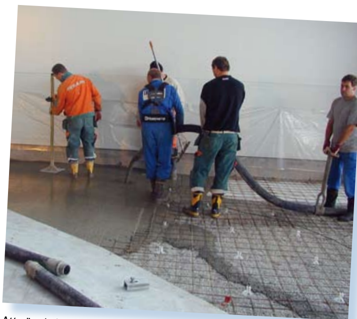
Att göra kyla av värme är ingen ny tanke, absorbtionskylskåpet uppfanns redan 1922. Innovationen i Slite att göra skridskois enligt samma idé har prisats som ett av de bästa Leader Plus-projekten i Sverige.

– Nu har vi även byggt en uppvärmd konstgräsplan. Till den återanvänder vi värmen som uppstår i processen när man gör kyla, säger Fredrik.