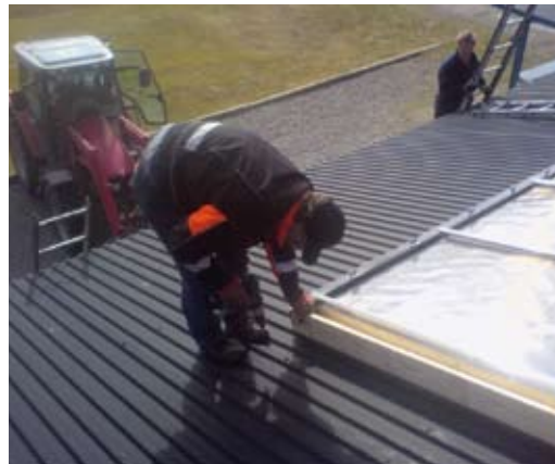
Solfångarna kom på plats omkring i maj 2009 och fungerar tillfredsställande. I början av oktober höll vattnet i tanken drygt 50 grader.