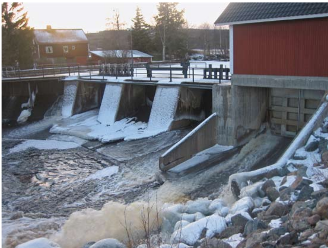
Det här vattenkraftverket ägs av Åbyggeby landsbygdscenter ekonomisk förening. En del av vinsten från elproduktionen används till byns samlingslokal och skolgård. Läs mer på sidan 9.

Kort sagt, göra det byarörelsen alltid gjort: Gräv där ni står!