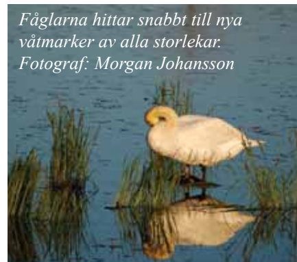
Fåglarna hittar snabbt till nya våtmarker av alla storlekar.

Om du önskar få ytterligare enskild rådgivning inom Greppa Näringen är du välkommen att bli medlem i