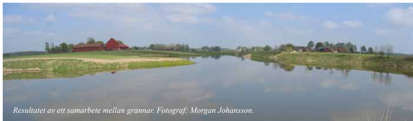
Resultatet av ett samarbete mellan grannar.