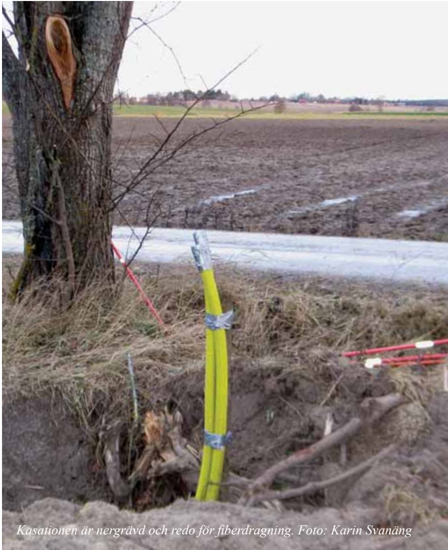
Kasationen är nergrävd och redo för fiberdragning.

kursdeltagarna möjlighet att skriva en ansökan till länsstyrelsen om stöd för bredbandsutbyggnad.