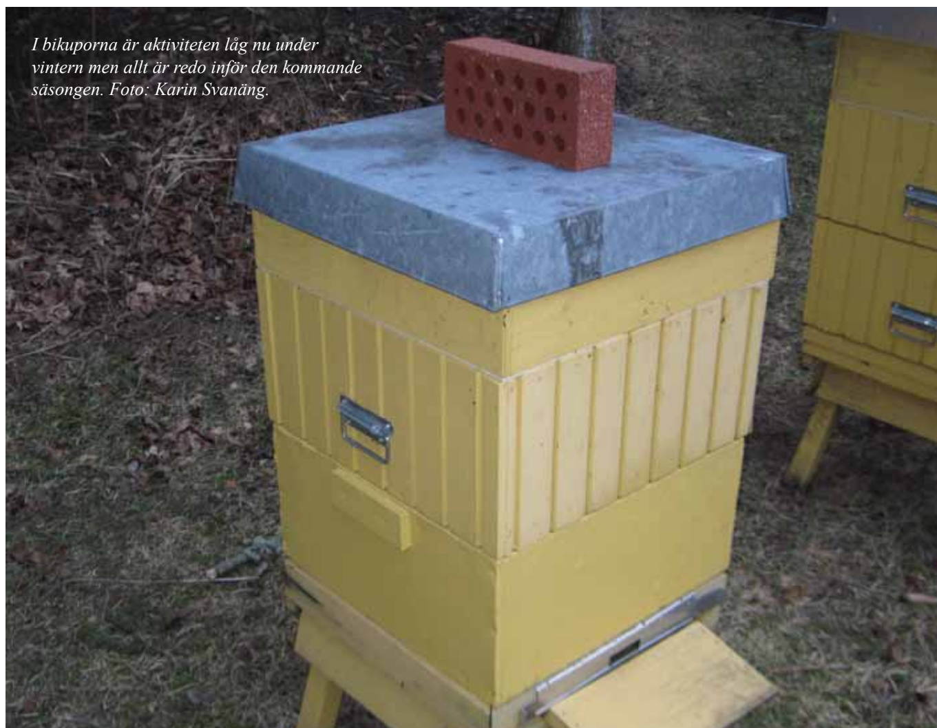
I bikuporna är aktiviteten låg nu under vintern men allt är redo inför den kommande säsongen.