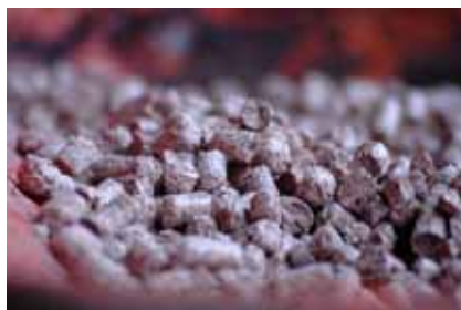
Pellets ett miljövänligt alternativ

Fyllig konferensdokumentation finns på vår hemsida www.mellanlanda.se och i bilaga till denna slutrapport.