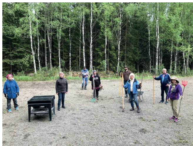
Deltagare vid vårstädningen med 2 meters avstånd mellan varandra.

Edsleskogs Byalag bjöd in till den sedvanliga vårstädningen av lek- och aktivitetsparken i samhället den 31/5 2020.