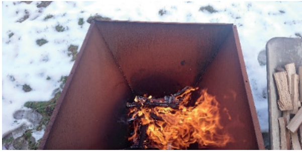
Eldning i Nortiki.