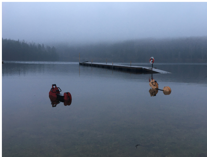
Översvämning vid badplatsen Dals Långed

Nu har det gått ett år i pandemins grepp. Att det skulle bli den omfattningen kunde vi inte föreställa oss våren 2020. Hur har det då påverkat oss i Vikens byalag?