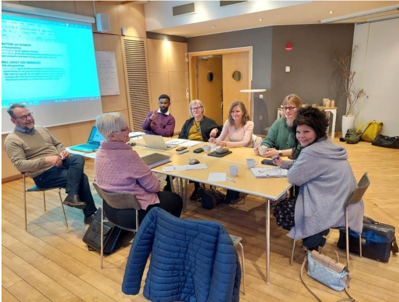
Bild från styrelsens planeringsmöte den 20-21 januari 2023