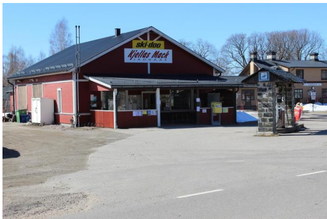
Kjellas Mack.

Upprätthålla och utveckla Kjellas Macks roll som en gemensam samlingsplats