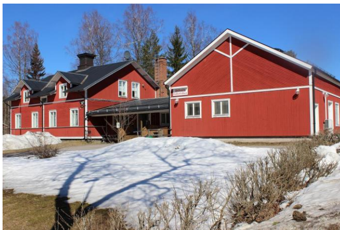
Folkets Hus.

Ha ett möte med ungdomarna och höra deras önskemål och försöka få dem delaktiga i det som händer på byn, eventuellt hålla i aktiviteter för de mindre barnen