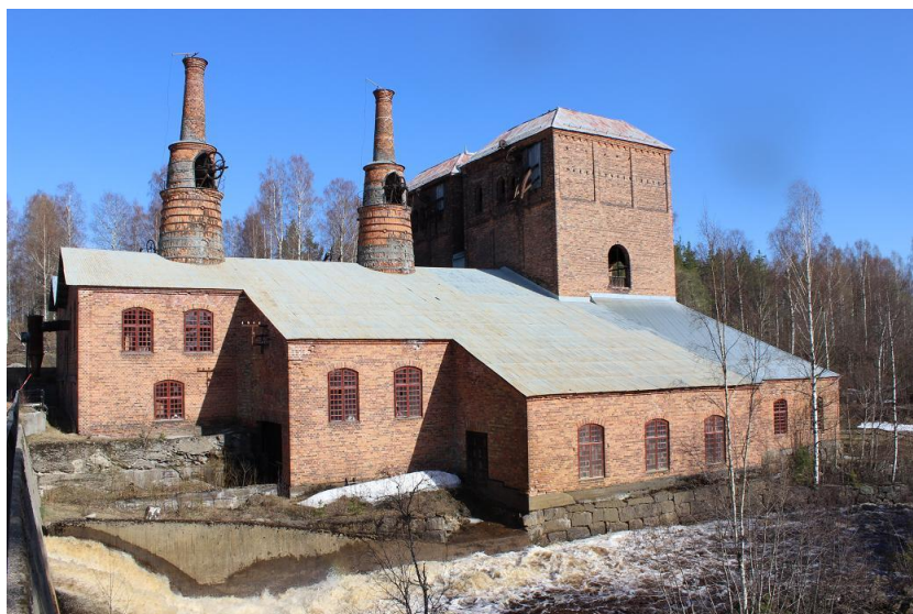
Jädraås Hytta.

Jädraås bruk anlades 1857 av ägaren till Ockelboverken, Joh. Alb. Salomon Åberg. Ockelboverken grundades på 1670-talet och järnhanteringen bedrevs på flera platser. År 1857 lades hyttan vid Åbron ned och en ny uppfördes 1856-57 vid Jädraås, vilket låg närmare gruvorna i Vintjärn samt hade god tillgång till vattenkraft.