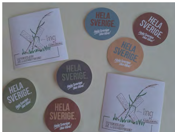
Nya och gamla logotyperna.

Vår första logga innehåller alltså själva essensen av X-ing. Länsbokstaven och associationen till Exing (Axing?), som är bygdemål för Kvickrot , ett gräs som är svårt att bli av med. Detta Axing uttalades äxing, även kallat efsing, röte, gräsrot och kvickvete i andra delar av Sverige. Inom folkmedicinen på medeltiden användes kvickrot mot blåskattarr och torkade kvickrottrötter användes även till rökelse.