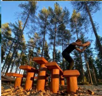
Vackra Dalälven, Österfärnebo kyrka och bygdens nya utegym.

Foto: Paulina Lingers, som även är en av två ordföranden i den lokala utvecklingsgruppen.