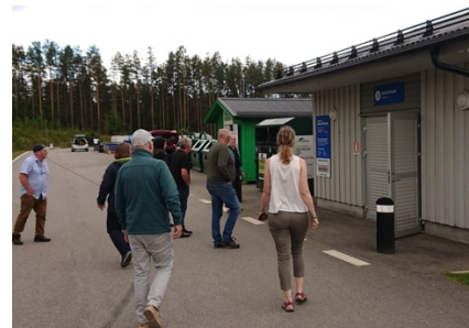
Källsortering och återbruk.

På anläggningen finns därför bl a en sorteringsstation för barn och stugor för inlämning av fritidsartiklar, kläder och second hand. Det finns också en välkomnande, parkliknande yta, rastplatser, samt personal som kan svara på alla frågor.