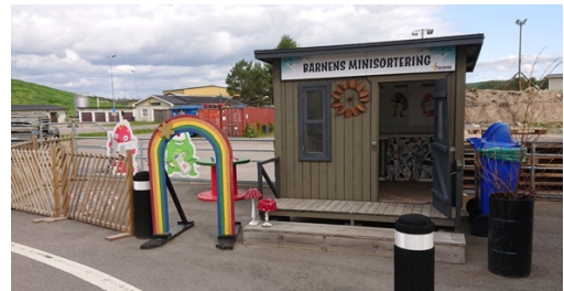
Barnens sorteringsstation.

Vi besökte även den del av anläggningen som är till för privatpersoners avfall och källsortering. Dock ej sopor och matavfall, det hämtas ju hos hushållen. Företaget arbetar ständigt med utbildning av allmänheten för att öka andelen avfall som kan återbrukas eller återvinnas.