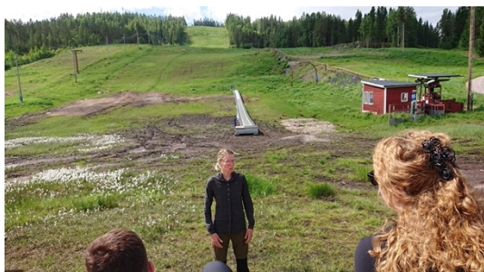
Backen vid Gårdtjärnsberget.

Därefter berättade hon om Biosfärområde Voxnadalen, som omfattar Voxnans avrinningsområde i fyra kommuner; Ovanåker, Bollnäs, Ljusdal och Rättvik. Området omfattar 342 000 ha, och här bor ca 13 200 personer. Arbetet med att få bilda ett Biosfärområde inleddes 2003, och 2019 utsågs de av Unesco. De har grundfinansiering från Naturvårdsverket och respektive kommun, för bl a ett kontor, samt projektmedel från olika finansiärer i olika delprojekt.