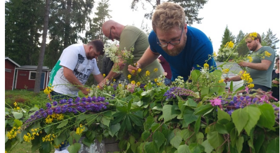
Arbete med klädning av stängen.

De olika länderna ligger olika långt framme i arbetet mot en grön omställning och därför blev det mycket intressanta diskussioner i efterföljande smågruppsarbeten.