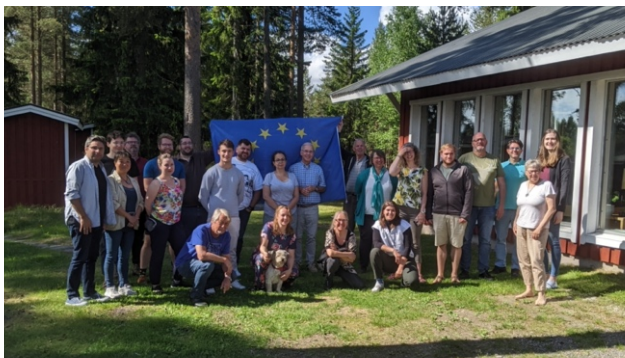
Hela gruppen samlad på gårdsplanen.