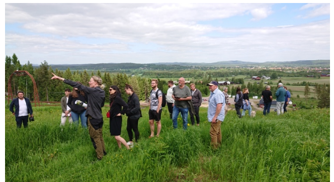
Utsikt uppifrån Gårdtjärnsberget.

I stället ska nu kor beta på (delar av) sluttningen, vilket förväntar minska behovet av röjning och (liksom i de två andra fokusområdena) öka den biologiska mångfalden. Detta främjar inte bara pollinerare och inhemska, ibland rödlistade, blomster, utan minskar också kostnaden både i pengar och människors tid. Dessutom kan köttet tas tillvara, och ingå i den lokala livsmedelsförsörjningen. Ett givande och trevligt studiebesök som dessutom gav utsikt över de vackra omgivningarna.