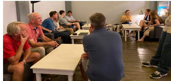
Samling första kvällen på Rhodos.