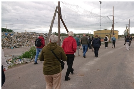
Avfall till förbränning.