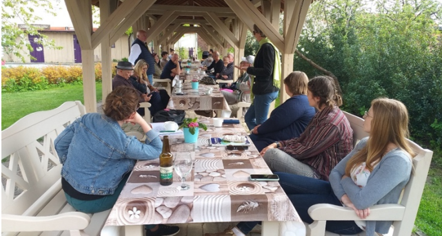
Deltagarna får en presentation.

Många av byns invånare saknade helt framtidstro och såg inget hopp att någonsin kunna förändra byns öde. Några entusiaster valde då att aktivt försöka ändra byn framtid. Man startade ett socialt företag med mål att locka till sig turister. Idag har byn över 200 invånare och tron på framtiden en helt annan. Man lockar varje år över 25 000 besökare, varav ca 5 000 är utländska. Man har ingen arbetslöshet alls och många små privata företag har knoppats av.