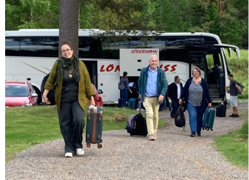
Ankomst till Gläntan!

20 förväntansfulla deltagare anlände med buss till Gläntan efter långa restimmar från respektive hemland: Polen, Grekland, Tyskland, Holland och Frankrike. Ett antal svenska medarbetare var redan på plats och välkomnade dem.