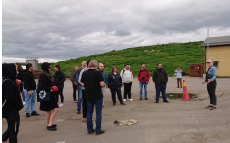
1 % av avfallet täcks över permanent (i bakgrunden).