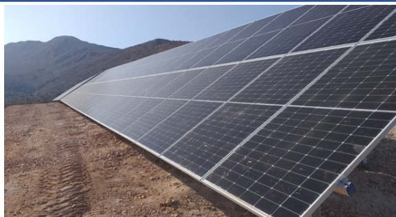
Solcellsanläggningen på ön Chalki.