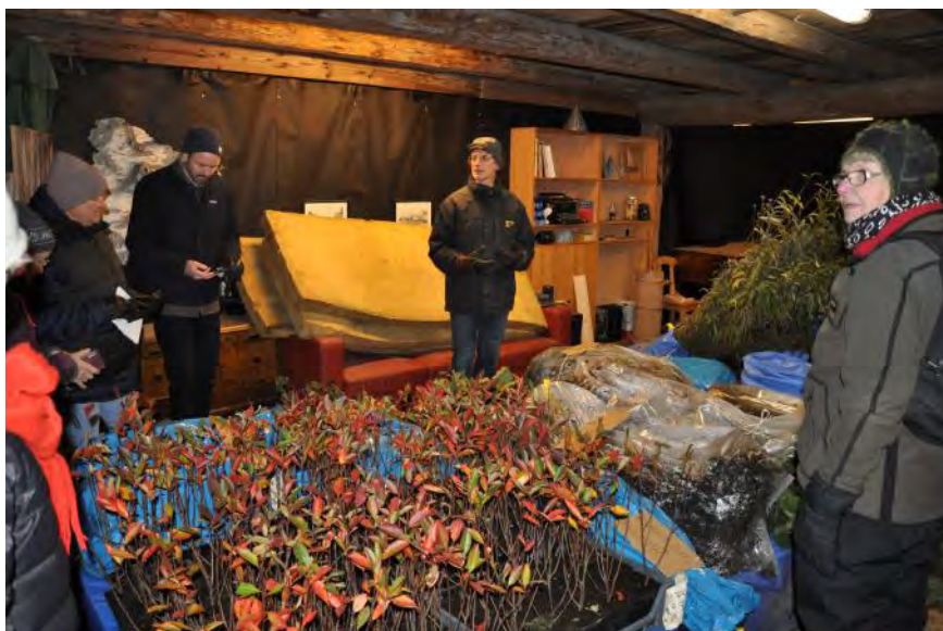
Deltagarna får inblick i Ranbogårdens omfattande odlingar. Hundratal plantor av bland annat fruktträd väntar på att planteras.

”Fixar vi maten så fixar vi planeten” – ett citat från Johan Rockström – var rubriken för ett heldagsseminarium om hållbar matproduktion på Mo bygdegård 7 november.