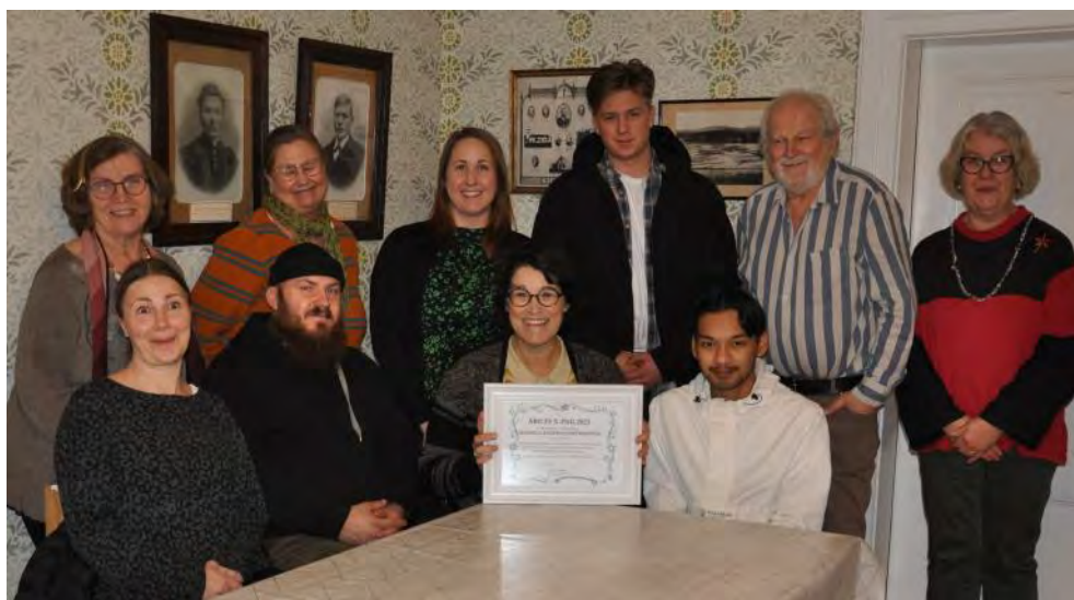
Hasselas Hembygdsförenings styrelse samt medlemmar.

Grabbarna berättar att Ugga har funnits ganska länge. Ugga var den enda ungdomsföreningen i kommunen innan