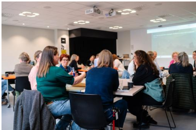
Coompanion hjälper till med workshops, rådgivning och verksamhetsutveckling för en starkare landsbygd i Gävleborg.

COOMPANION Kooperativ Utveckling Coompanion Gävleborg finns på gavleborg@coompanion.se eller https://coompanion.se/gavleborg/