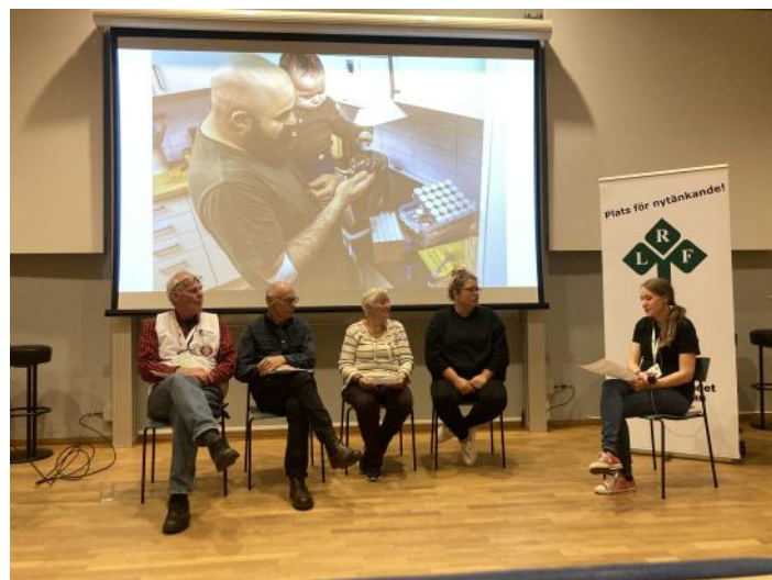
Till vänster: Collage från beredskapsdagen i Edsbyn. Skärmdump från X-ings Facebooksida. Fotograf Mikael Persson. Övan: Från paneldebatten i Söderhamn. Foto Olle Persson.