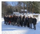
På studiebesök hos Svågadalensnämnden.