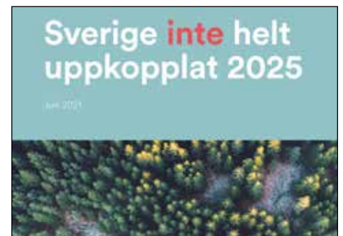
Rapporten Sverige är inte uppkopplat 2025

https://www.lansstyrelsen.se/halland/tjanster/publikationer/tips-pa-medeltida-besoksmal-i-hallands-lan.html