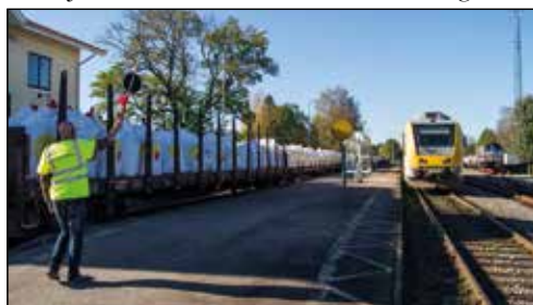
På södra HNJ är tågklareringen fortfarande manuell. Här får Krösatåg mot Halmstad klart för avgång i Torup.

Halmstad till Östergötland/Stockholm/Mälardalen (med tågbyte i Nässjö). Krösatågen på HNJ kan med lämplig marknadsföring avlasta Öresunds- och Västtågen längs kusten. Restiderna Halmstad–Stockholm via HNJ matchar tämligen väl restiden via Västkustbanan och Göteborg och i ännu högre grad med ett upprustat spår.