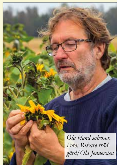
Ola bland solrosor.