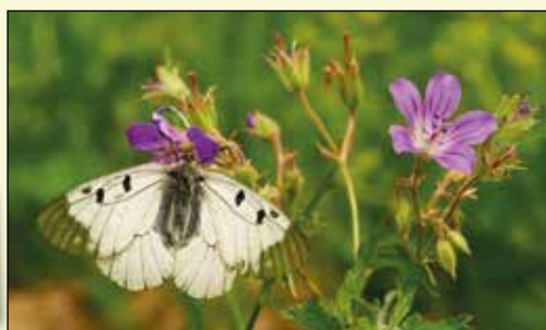
Mnemosynefjäril på blånäva.