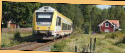
Krösatågen genom Halland körs med Itino-tåg byggda av Bombardier. Deras livslängd börjar närma sig slutet.