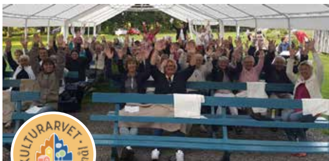
Allsångskväll på Lindekullen