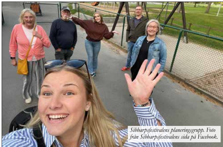
Sibbarpsfestivalens planeringsgrupp.