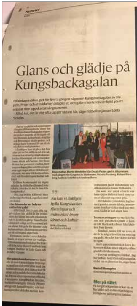
Del av uppslaget i Kungsbacka-Posten.

Till priset Årets eldsjäl kan personer nomineras som har gjort ett extraordinärt och betydelsefullt arbete inom den ideella