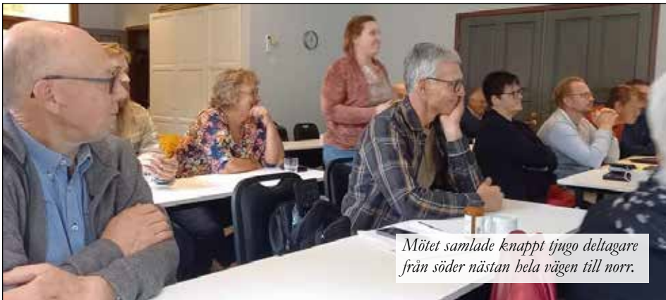
Mötet samlade knappt tjugo deltagare från söder nästan hela vägen till norr.