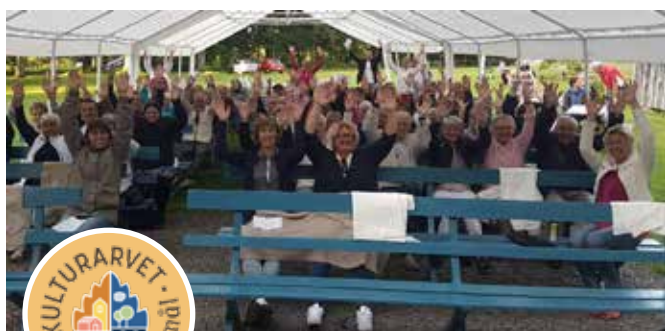
Allsångskväll på Lindeskullen