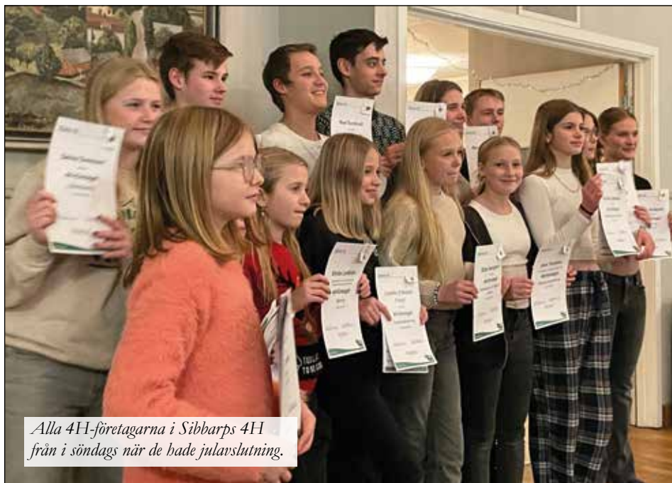
Alla 4H-företagarna i Sibbarps 4H från i söndags när de hade julavslutning.

Sibbarp-Dagsås Föreningsråd är en paraplyförening för alla föreningar i bygden. Hemsida: www.sibbarpdagsas.se Facebook; ”Vi som bor i Sibbarp och Dagsås i Halland”.