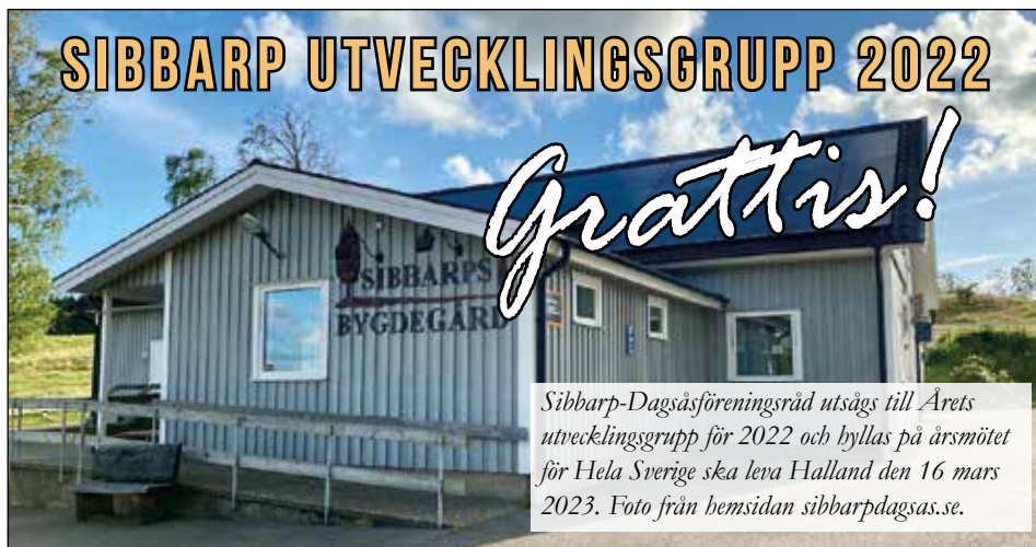
Sibbarp-Dagsås-föreningsråd utsågs till Årets utvecklingsgrupp för 2022 och hyllas på årsmötet för Hela Sverige ska leva Halland den 16 mars 2023.