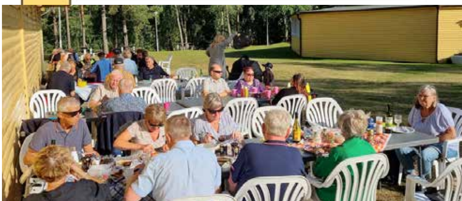
Ätrans Samhällsförening: Tack till alla er som var med och bidrog till en mysig grillkväll på Sjöviken.

Tipsa oss genom att mejla till drangsereds_golf@outlook.com eller genom att ta kontakt med oss på facebook eller instagram