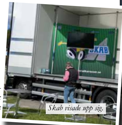
Skab visade upp sig.