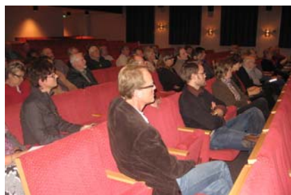
Länsträffen 6 november