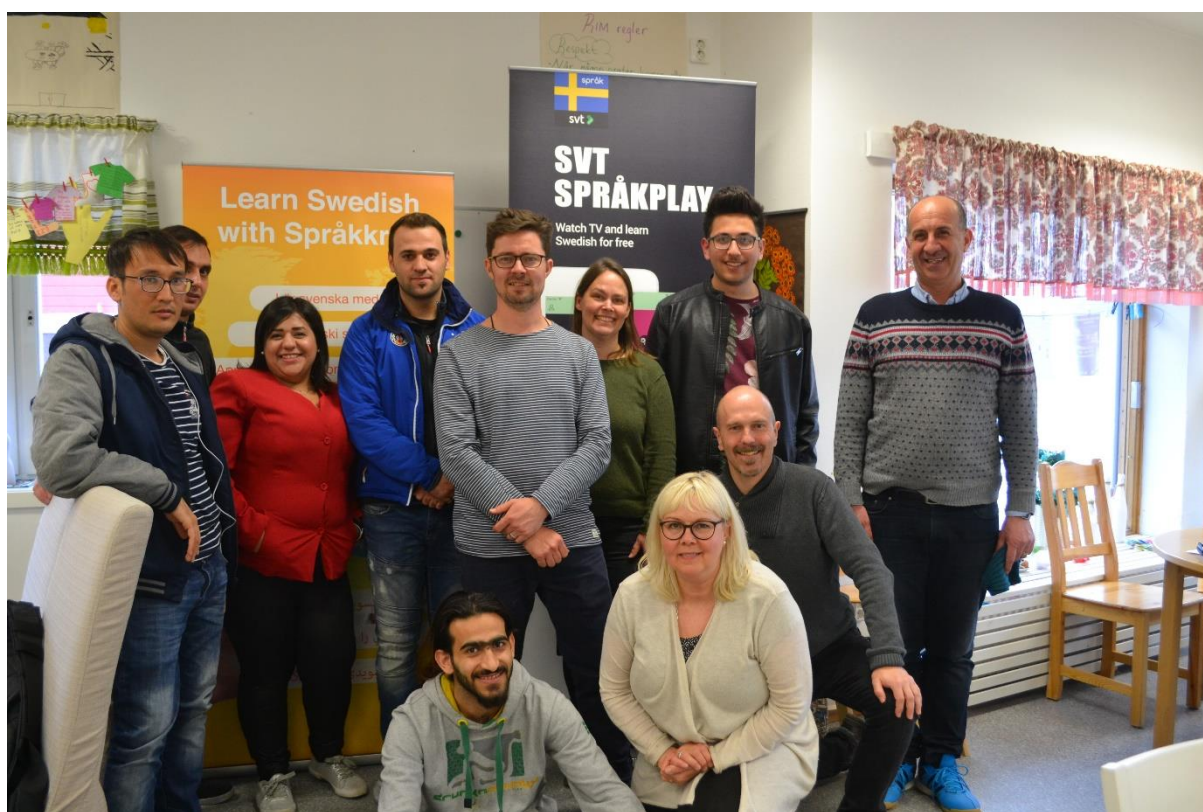
Språkkraft och SVT informerar potentiella användare i Kiruna

Till skillnad från läromedel som en författare skapar vid en viss tidpunkt och som snabbt blir utdaterad så är Språkkrafts hjälpmedel dynamiska. I dagsläget finns tre olika digitala applikationer. Den mest spridda är SVT Språkplay. Den nyttjar det faktum att SVT undertextar sina program för hörselskadade på svenska. I appen blir undertexten interaktiv så att man kan klicka på orden och få en översättning när det är något som man inte förstår. Idag finns stöd för hela 29 vanliga invandrarspråk, från arabiska till turkiska. Att lära sig ett språk är en stor utmaning. Det är mycket att lära. Språkkraft hjälper till att prioritera genom att visa vilka ord (gröna) som man redan bör kunna på den språknivå man befinner sig på, vilka ord som man bör lära sig just nu (gula) och vilka man kan vänta med till senare (röda). När man tittat färdigt på ett program kan man sedan repetera och lära sig orden genom