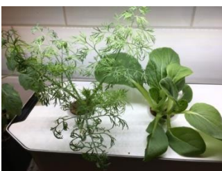
hydrobolisk odling på diskbänken!