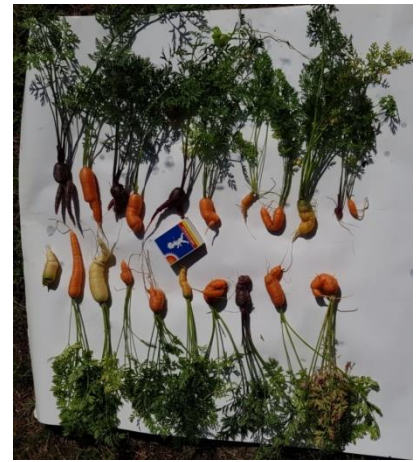
Krokiga morötter och förvridna paprikor