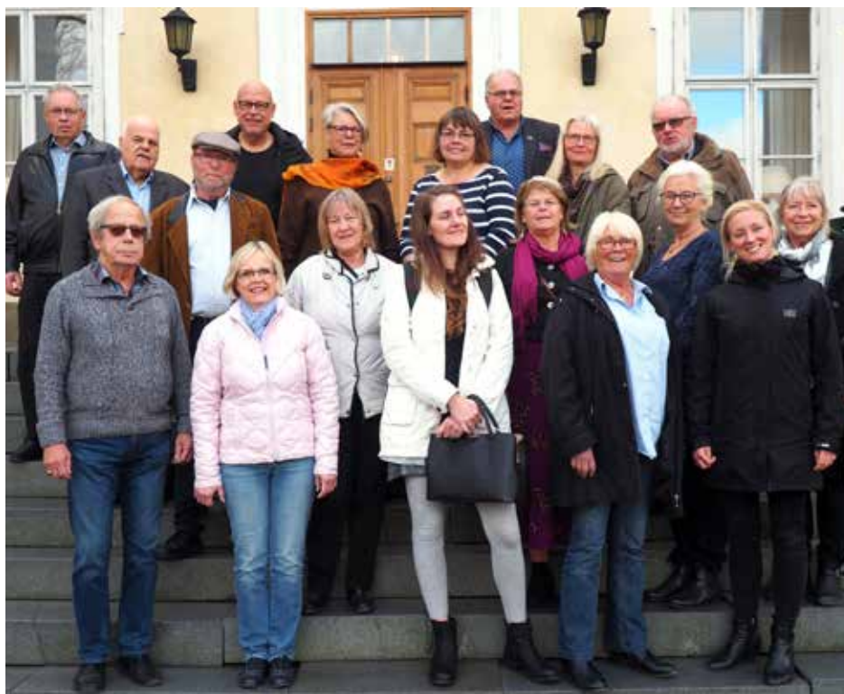
HSSL Mitt träffades på Haga slott i oktober.