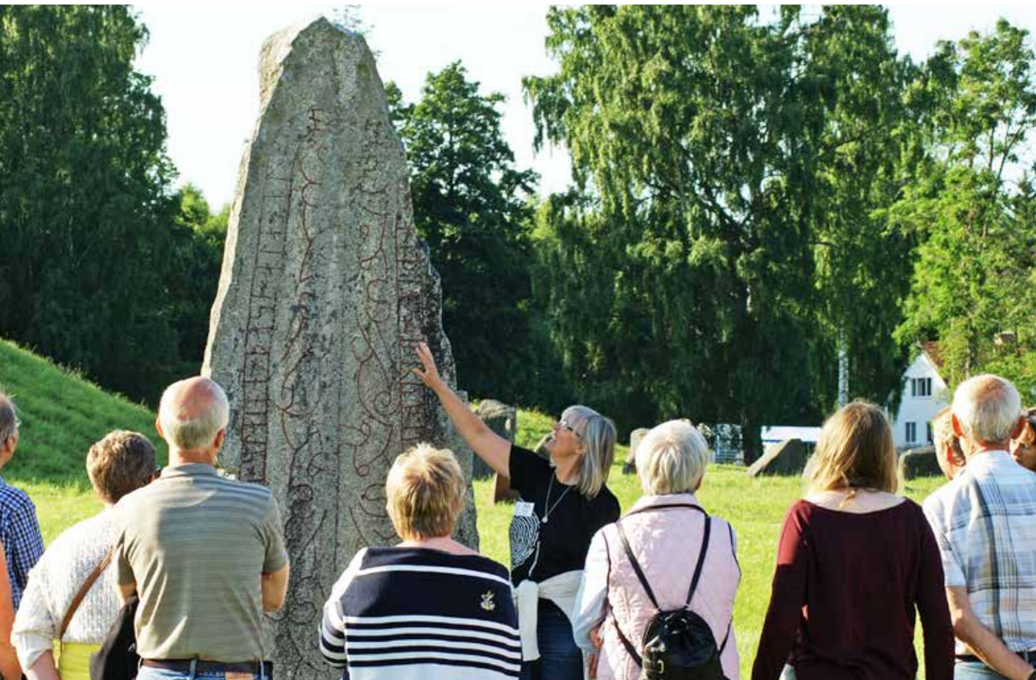
Hembygdspåreningens guider tar årligen hand om över 3000 besökare vid 100 schemalagda historiska guidningar vid Anundshögsområdet.

Valborgsmässöfirande Valborg är det publikmässigt näst största arrangemanget. Tre tusen kommer då till Anundshög för att hälsa våren välkommen. Man samlas vid Café Anund där vårdkasen tänds av föreningens järnåldersklädda guider. Därefter följer vårtal och sång av Kyrkokören. Som avslutning på kvällen avfyras ett mäktigt fyrverkeri från toppen av Anundshög.