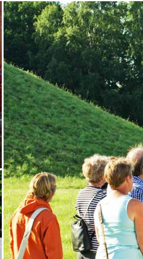
Midsommarfirande, valborgsmassofirande, guidning och fackelvandring är bara några få av de aktiviteter som hembygdsföreningen ordnar.