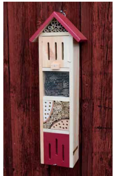
Slå ett slag för den biologiska mångfalden och skaffa ett litet "insectshottell".