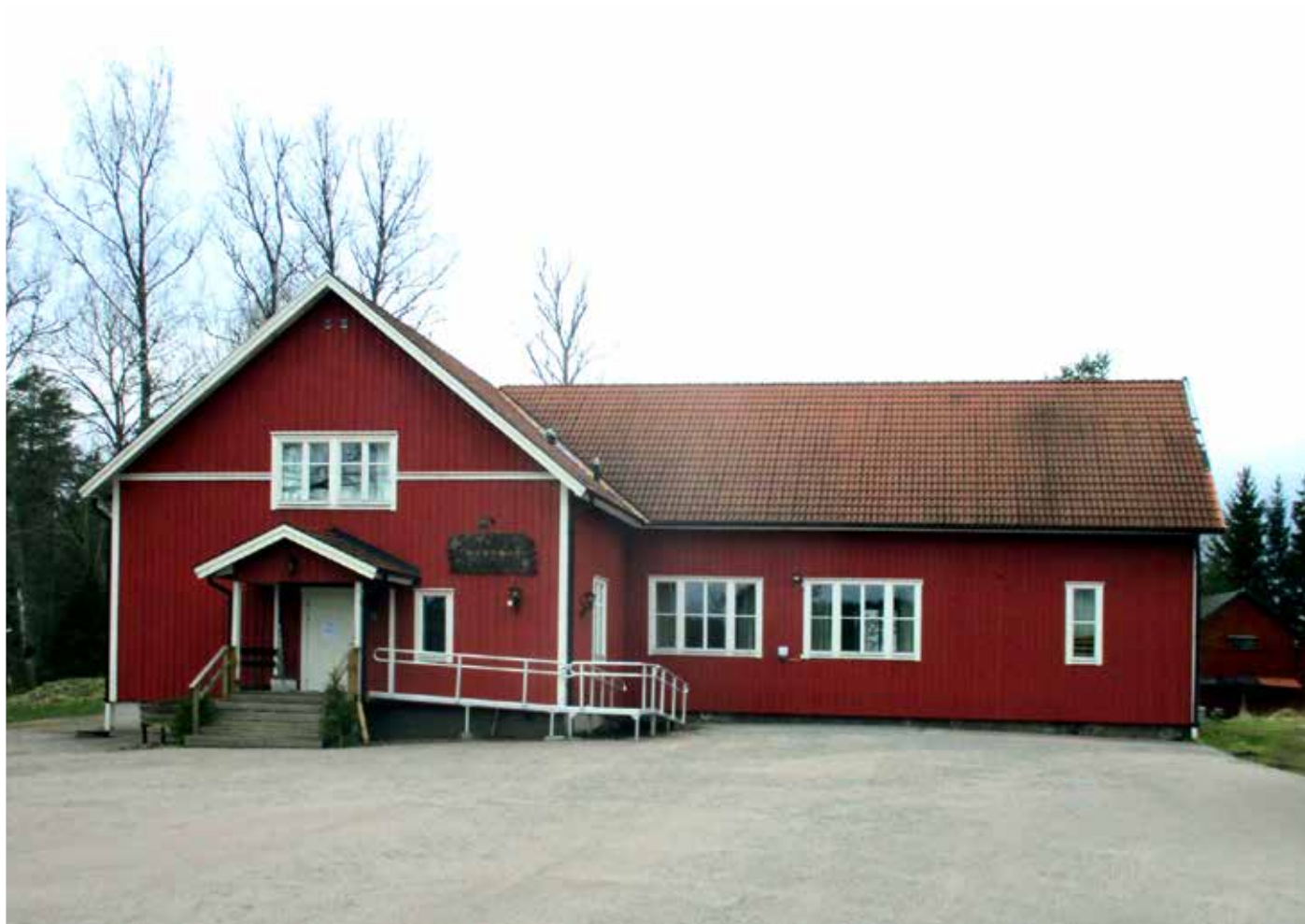
Medåkers Bygdegård är ortens naturliga samlingspunkt.