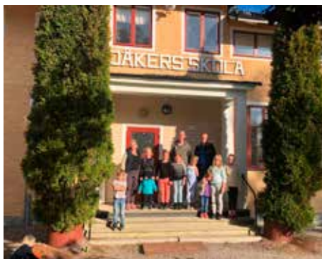
Föräldrar och barn vill ha sin skola kvar.