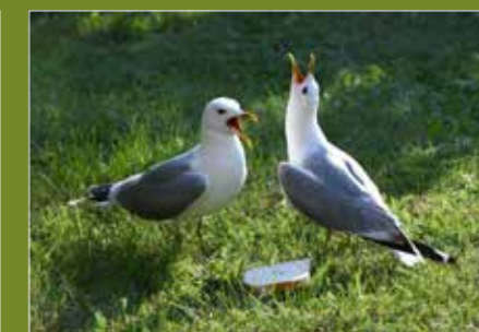
– Trevligt med gemensam frukost.