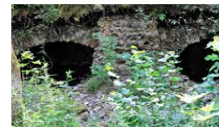
Smedernas jordkällare saknar nu dörrar.