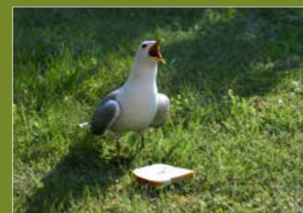
– Frukosten serverad!