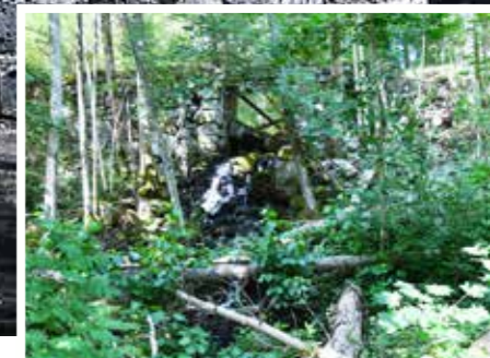
Den gamla bron