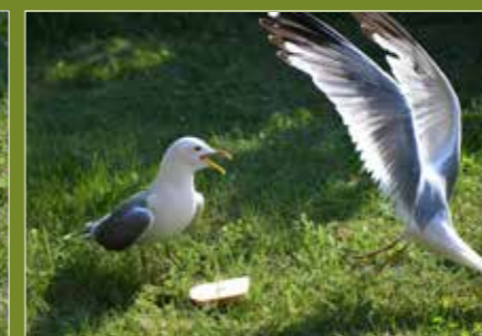
– Jag kommer!