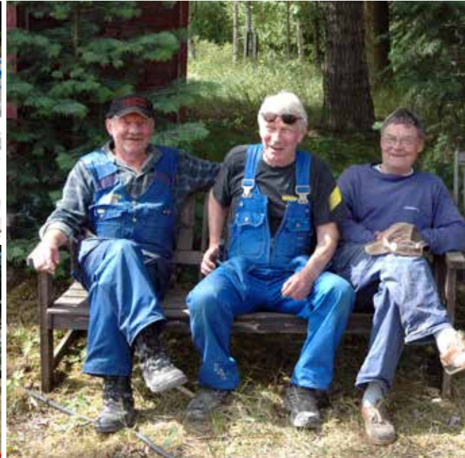
...kunde vi pusta ut ett tag.