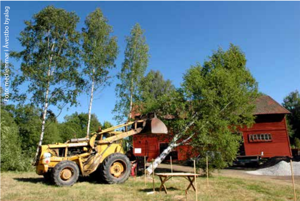
Vi började med att ta bort träden.