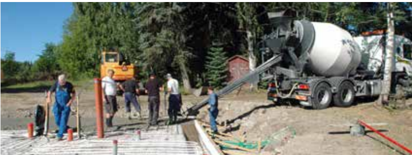
Grundformen var ett noggrant arbete. När cementbilen kom och plattan blev klar...