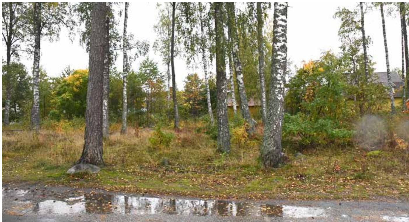
Utvecklingsgruppen undersöker möjligheten att bygga ett allaktivitetshus i denna björkdunge, som ligger strax bakom samhällets affär.