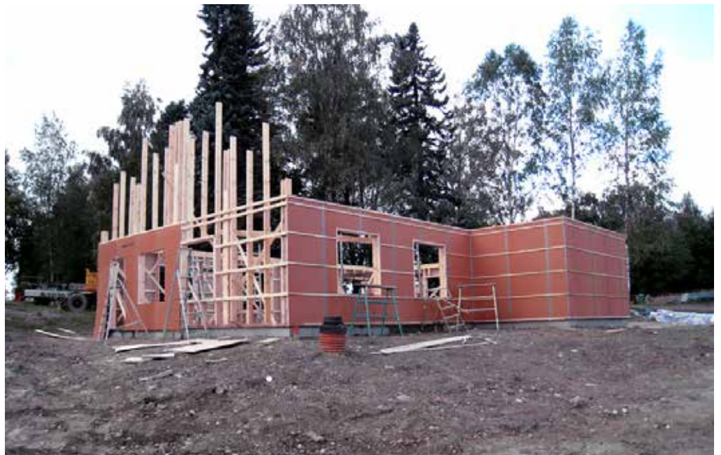
Nu började vi se hur vår byggnad skulle se ut.

Åvestbo är en liten by strax utanför Fagersta. Här finns det mycket aktiva Åvestbo Byalag. För drygt 10 år sedan hamnade byalaget i en stor och hotande kris. Man blev husvilla. De hade all sin verksamhet i Hemvärnsgården. Hemvärnet som ägde gården behövde då hela gården för eget bruk.