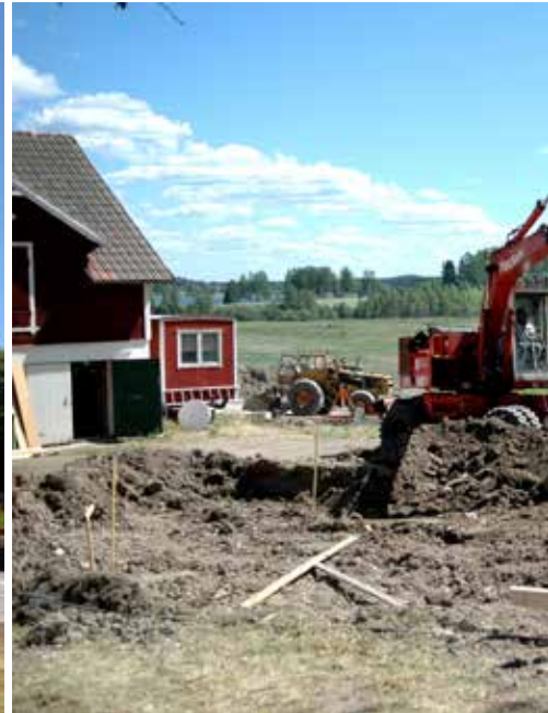
Sedan förberedde vi grunden.