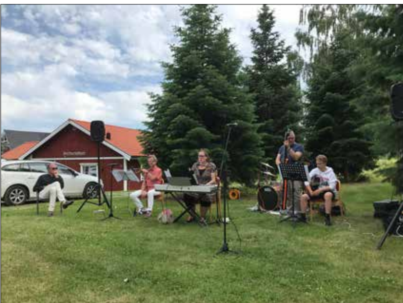
Friluftsgudstjänst vid bygdegården.