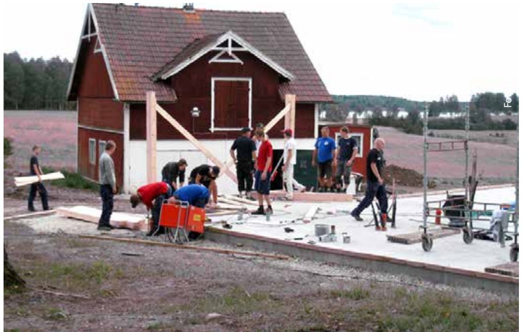
Vi var många som deltog i arbetet.