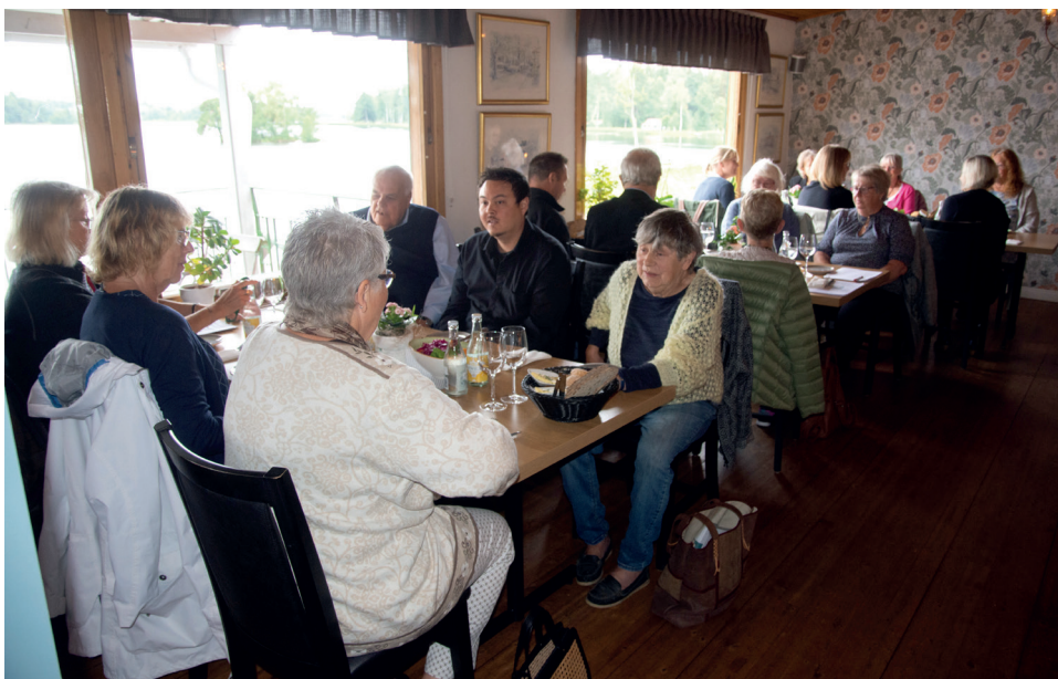
Deltagarna på gemensam lunch på Måns Ols restaurang i Sala.

Den 28 augusti höll Länsbygderådet sitt årsmöte för år 2020. Mötet skulle enligt stadgarna ha hållits före april månads utgång. Men som allt annat under första halvåret så tvingades vi, på grund av pandemirestriktionerna, skjuta upp mötet.