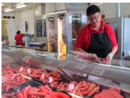
Lockande överflöd hos Carlströms.

Den långa glasdisken med mängder av styckningsbitar i butiken får dela plats med många sorters korv, men därtill lockas ögat av rökta och kokta produkter för pålägg eller kallskuret. Vilken lycka, att kunna välja kött och korv med hjälp av kunnig personal – och inte ett enda plasttråg fyllt med konserverande gas ses någonstans!