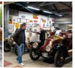
Komplicerat hantverk med gott resultat – ett historiskt fordon har fått liv

skulle kunna besökas. Vid rundresan kunde speciella skyltar med zeboramönster i färg hjälpa besökarna till rätta – mycket praktiskt.