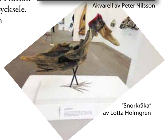
"Snorkråka" av Lotta Holmgren