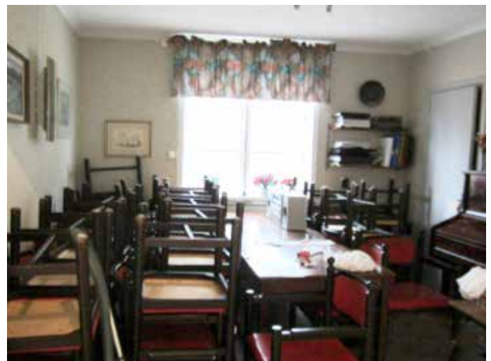
Biblioteket innan rusten

I det rum som numera går under benämningen " Biblioteket " har både tak och väggar målats i samma stil som det stora rummet. En ny bokhylla har monterats och den gamla orgeln har burits bort. Detta har resulterat i ett mycket rymligare rum och en bättre samhörighet med det stora rummet.