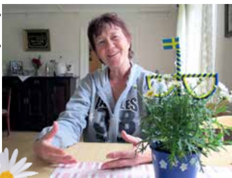
Regina vid sommartid

För att kunna hålla kontakterna med folk i närområdet behöver man vara bosatt där. Detta gäller i synnerhet de flitiga medlemmarna i styrelser för ideella föreningar av olika slag. När så styrelsen för HSSL/Västmanland behöver förstärkning, då blir det jobbigt för alla som tillfrågas: alla har minst ett ideellt uppdrag för mycket redan, krävande yrkesarbete, hus, snoriga barnbarn hela tiden osv osv.