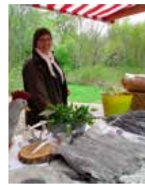
Försäljning av lokala produkter

Safarin inleddes lämpligen med ett besök i källaren på Kungsudden-byggnaden, där kungen bjöd in till besök. Här fanns utställande konstnärer representerade med exempel på sin konst och katalogen erbjöds för att det som fångade intresset