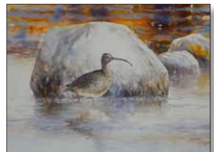
Akvarell av Peter Nilsson