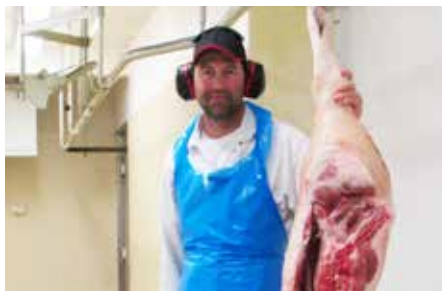
En dalmas i förskingringen styckar grisen på nolltid.

väggarna. De är tecken på charkuteribransschens uppskattning av Carlströms produkter, särskilt för de korvar som görs här. Årliga tävlingar har satt Carlströms korvar på första plats sedan flera år och en nationell placering på andra eller tredje plats skäms inte heller för sig. Korvarna är naturligtvis sinsemellan olika, men det höga innehållet av kött och de få och ringa tillsatserna är genomgående.