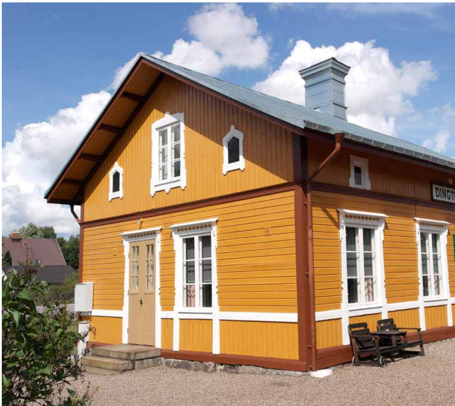
Den nymålade stationsbyggnaden lyser idag i samma färger som vid invigningen för drygt 100 år sedan.

Förutom ett stort arbete med flytt och återuppbyggnad av godsmagasinet har medlemmarna nyss avslutat en omfattande renovering av stationshuset. Inte nog med att de själva skaffat fram pengarna till renovering och ommålning, de har också gjort allt arbete själva. Dessutom lyser den nymålade byggnaden idag i samma färger som vid invigningen för gott och väl hundra år sedan: väggarna är solgula och snickerier i övrigt vita.