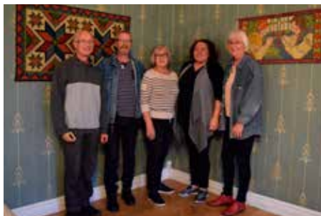
Delar av styrelsen.