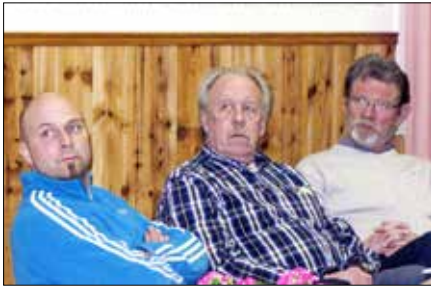
Publik i Torpa