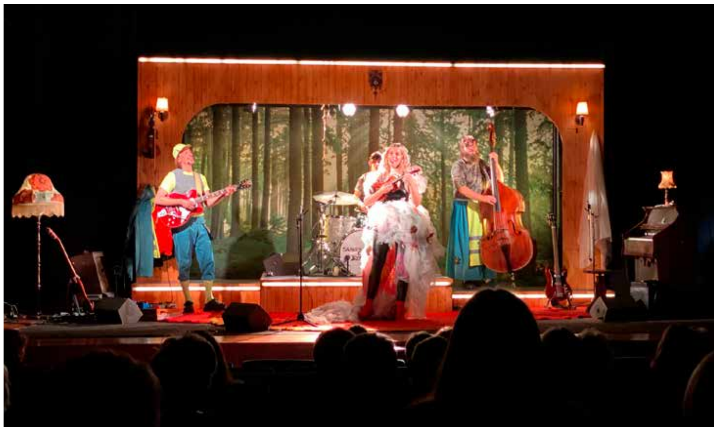
Riksteaterns föreställning "Landsbygdsupproret" i Surahammars Folkets Hus.