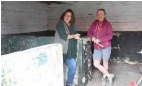
Så här såg det ut i svinstian innan ombyggnaden.