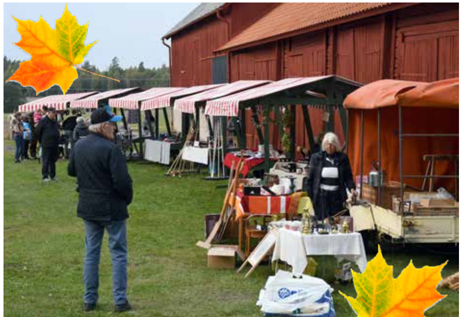
Den traditionella höstmarknaden.