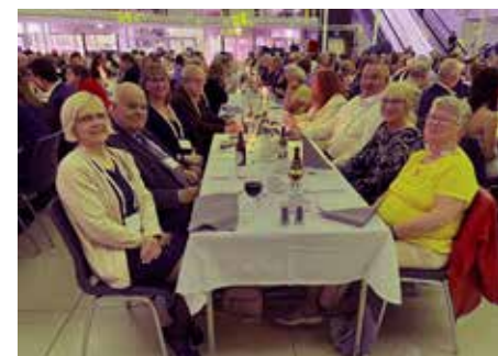
I väntan på mat. Västmanlandsgänget vid galamiddagen.

Lördagen avslutades med en stor bankettmiddag då Årets lokala utvecklingsgrupp, Årets kommun och Årets grymmaste håla presenterades och fick motta priser.