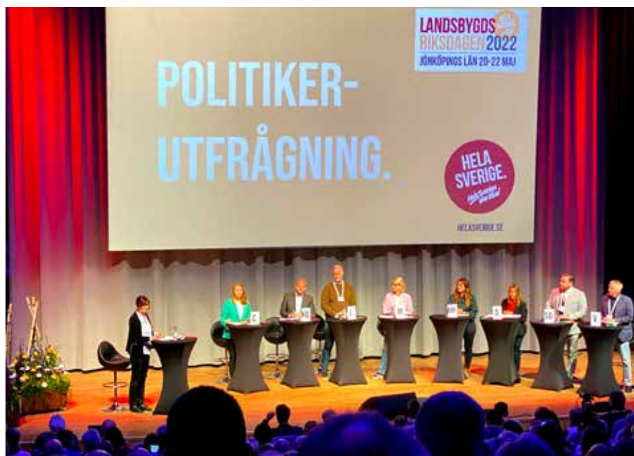
Politikernas framträdande under Landsbygdsriksdagen.

Fredagen inleddes med ett stort antal inspirationsresor ut till platser i Jönköpings län. Själv deltog jag i en resa till Vaggeryds kommun. Det mest intressanta på den resan var ett besök på ett kopensionat. När mjölk-