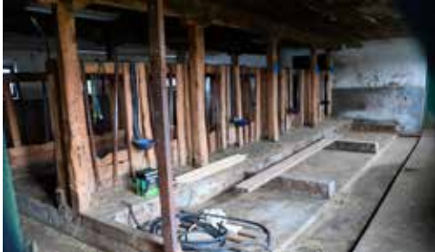
Kobåsen och mjölkrummet kommer att bli samlingshall och kök.