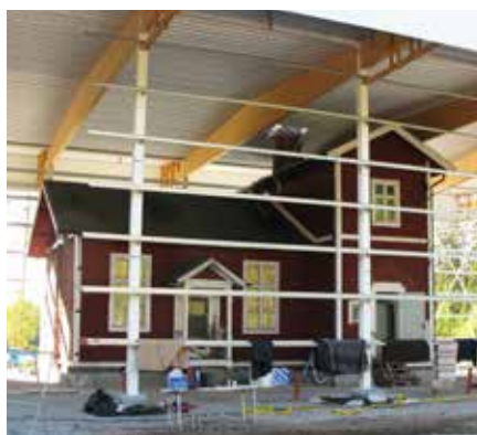
Teatermaskinen var nominerade till Årets Landsbygdsprojekt, men föll på mållinjen.

Servicepunkten i Möklinta till goda och omfattande insatser, var och en på sitt område, med förhoppningen att 2013 års vinnare kommer från Västmanland!