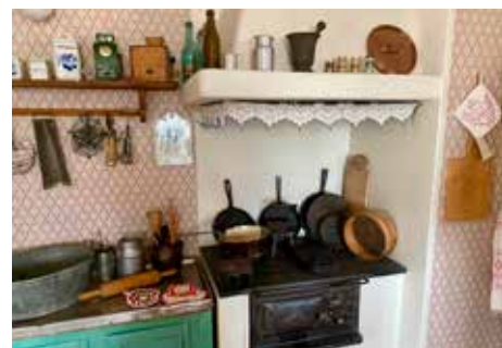
Köket i arbetarbostaden i Stenhuset, Surahammar.

Gemensamt för de allra flesta besöksmålen är att de alla ligger kvar på den plats där de alltid har legat. De är inte flyttade till någon gemensam museibygnad. När man besöker dessa platser är man på exakt den plats där historien tidigare utspelas. Här behöver man själv bara bidra med ett minimum av fantasi för att förflytta sig bakåt i tiden och kunna delta i dåtidens liv och leverne. På det sättet blir man en del i historiebilden bara genom att besöka dessa så viktiga och värdefulla platser.