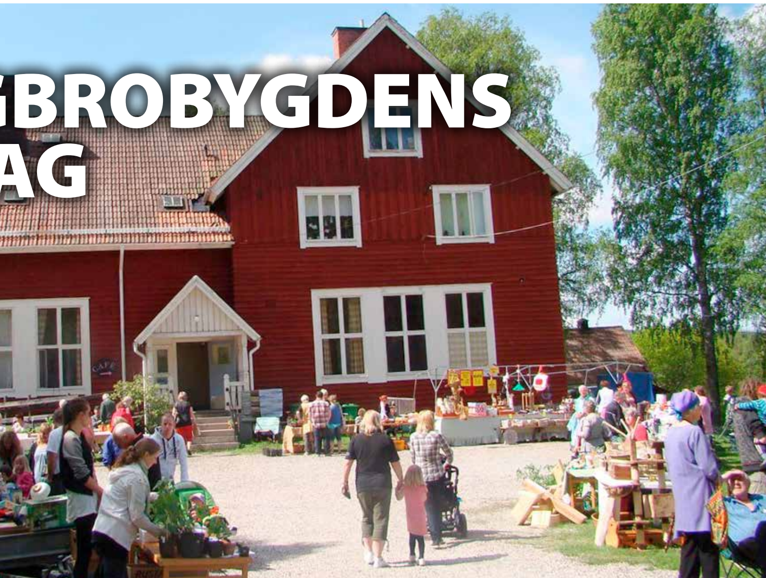
Bygdegården, som tidigare var byns skola.