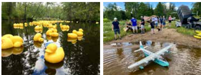
Ankrace och modellflygare under Baggbrodagen.