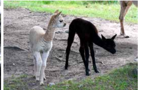
Alpackalammen är riktiga charmtroll.