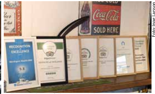
Hyllorna i Puben är fulla av utmärkelser.