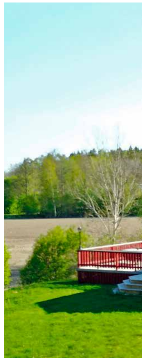
Esbjörnsgården - Kung Karls Bygdegårdsförening