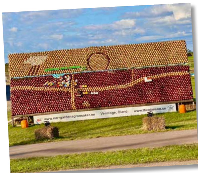
Varje år gör Ölandskonstnären Theo Janson en numera välkända löktavla. Tavlan gjord av tillsammans 6000 gul-, röd-, silver- och vitlökar ibland också av purjolökar.