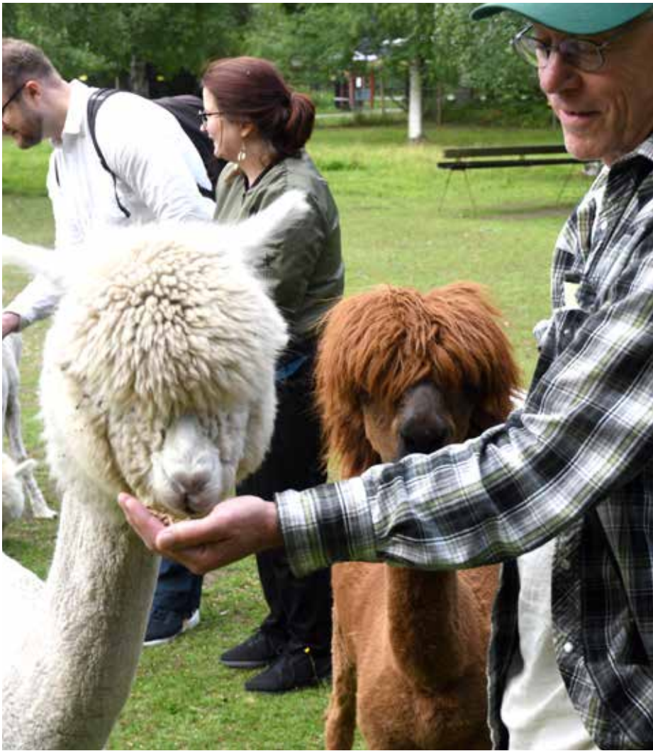
Norrgårdens alpackor älskar att umgås med människor.