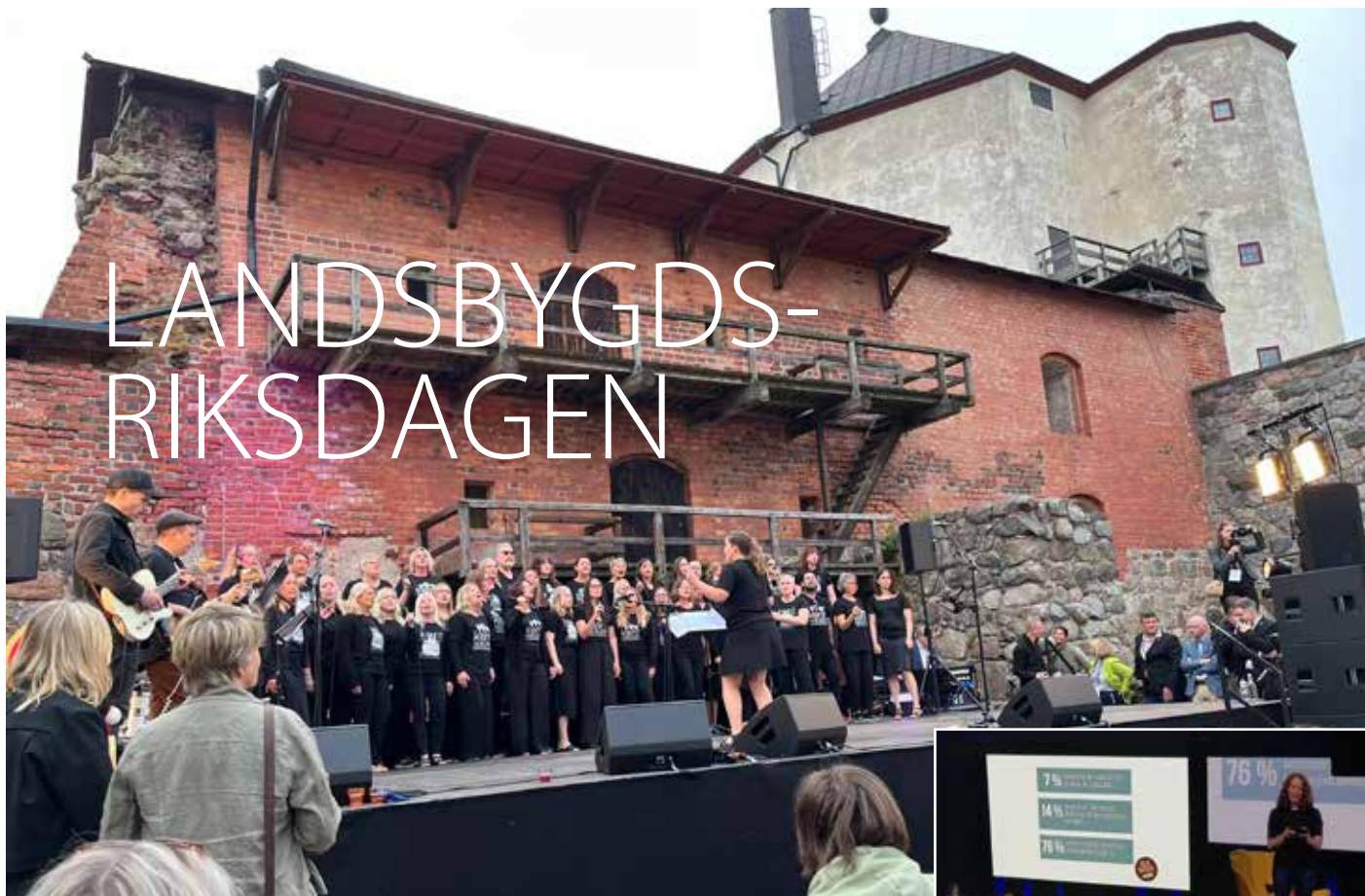
Invigningsfesten i Nyköpingshus slottsruin med bland andra Kentkören Non Stop från Eskilstuna.