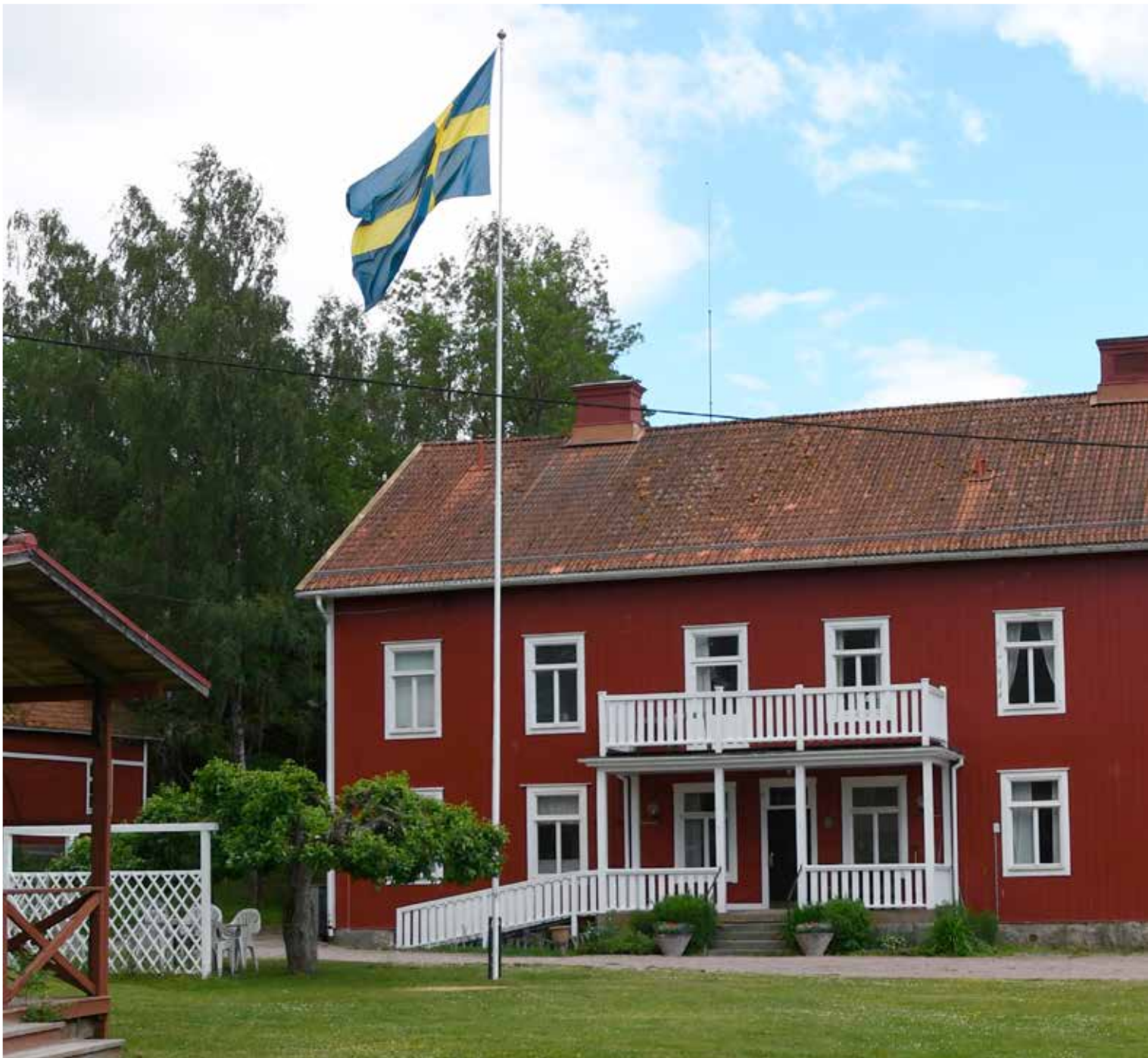
Flaggan i topp på nationaldagen vid Rytterne hembygdsgård.