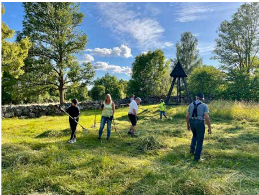
En av hembygdsföreningens aktiviteter är "Slätter vid Lilla kyrkoruinen".