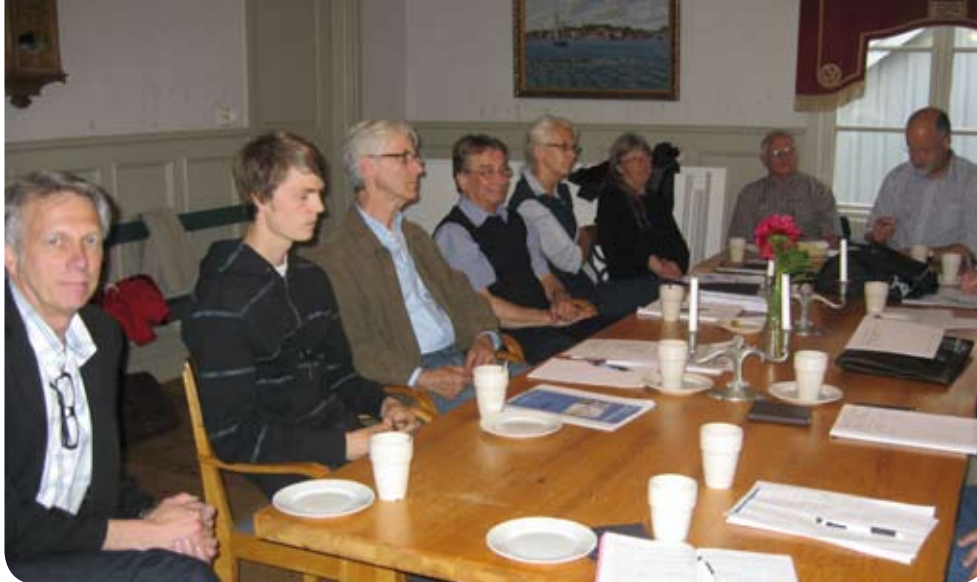
Här pågår lokal planering i Öregrund, Östhammars kommun.

“Öregrund sjuder av engagemang och framtidsanda. För nu finns det en plan. En plan som kommer att befästa Öregrundns ställning som ett centrum för båtturism i Upplands norra skärgård.” Ur inspirationsblad om Öregrundns utvecklingsplan