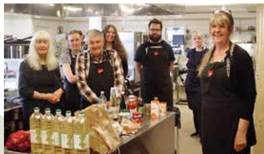
Deltagare i kursen Meet a local som genomfördes i projektets regi.

”Insatser för att främja mer lokalproducerat och en ökad förädling av lokala råvaror har prioriterats.